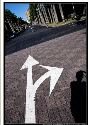
你決定好未來的方向了嗎?