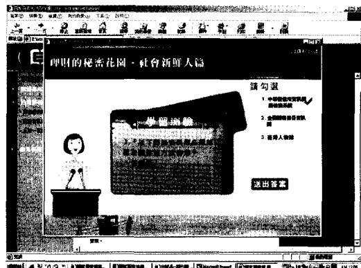
▲ 圖四：自我學習測驗畫面