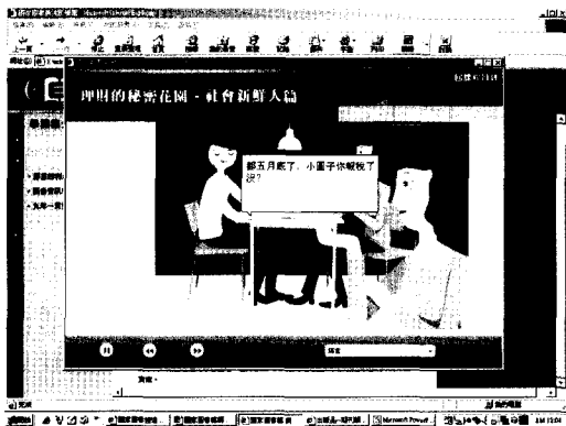
▲ 圖三：影音課程畫面

本文主要參考國家圖書館遠距學園課程「國家圖書館網路資源—財經篇」。「遠距學園」網址： http://cu.ncl.edu.tw/ 。「國家圖書館網路資源—財經篇」課程網址： http://cu.ncl.edu.tw/1000110138/clas/index.htm 。