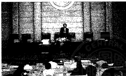
莊館長於研討會上致詞