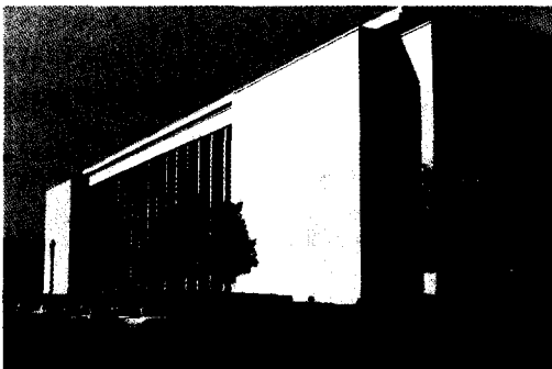
圖三 美國國會圖書館的麥迪遜大樓 (Madison Building)

這三棟大樓的地下室都有地道相連，工作人員或讀者不需要穿越馬路，即可穿梭於這三棟大樓之間，也算便利。