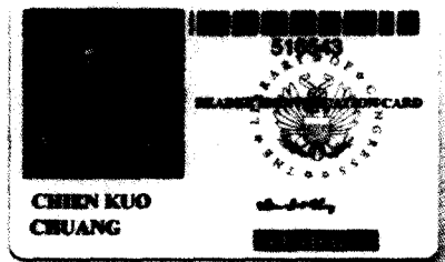
圖五 美國國會圖書館閱覽證

美國國會圖書館的功能與一般圖書館不同，爲了保護典籍的安全，書庫是不對外開放的，一般讀者只能在閱覽室閱讀，不能任意將書刊攜出。凡是高中以上畢業者，提出有照片的正式身份證件，都可向國會圖書館申請辦理免費閱覽證，外國人持護照即可申請。工作人員利用網路攝影機現場拍攝申請者的照片，並請申請者在手寫板上親自簽名，不到一分鐘後，當場就可取得附有照片及簽名的閱覽證，閱覽證的有效期限爲兩年，期滿後需重新申請（圖五）。