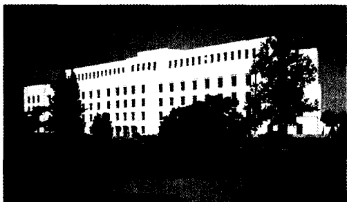
圖二 美國國會圖書館的亞當斯大樓 (Adams Building)

同樣的，亞當斯大樓很快就不敷使用，國會又在 1965 年 10 月通過決議，撥款 7,500 萬美元增建一座具有現代風格的藏書樓，將它命名為麥迪遜大樓，以紀念美國憲法和人權法案之父——第四任總統麥迪遜。但是這座大樓的建造過程，受了財政問題影響，拖到 1980 年 4 月才完工，耗資 1 億 3 千萬美元，佔地 46 英畝的麥迪遜大樓也成為世界上面積最大的圖書館建築，在華府僅次於國防部五角大廈和聯邦調查局大樓。