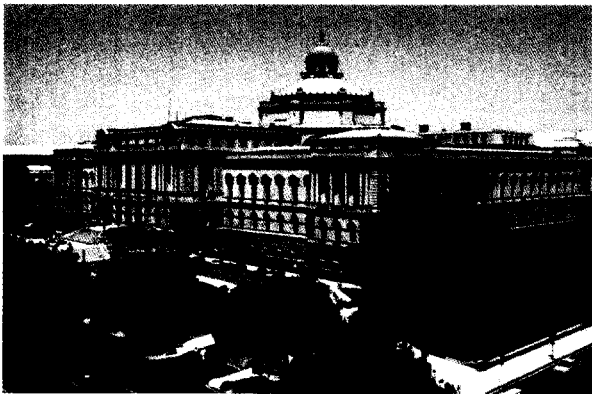
圖一 美國國會圖書館的傑佛遜大樓（Jefferson Building）

根據金氏世界記錄（Guinness World Records）記載，美國國會圖書館是當今世界最大的圖書館，收錄文件超過 1 億 2 千 8 百萬件，包括圖書 2 千 9 百萬冊，270 萬件錄音資料，1 千 2 百萬張相片，480 萬張地圖，5 千 7 百萬張手稿。其中最珍貴的資料包括世界上最早的一部印刷本聖經及手抄本聖經，固定陳列於傑佛遜大樓的二樓大廳，供民眾參觀。圖書館正式職員有 4,151 位，分別在三棟大樓內工作，傑佛遜大樓（Jefferson Building）、亞當斯大樓（Adams Building）、麥迪遜大樓（Madison Building）。每年服務遊客與讀者約一百萬人次。每年拜訪圖書館網站人次約 26 億（每秒約 82 人次）。年度經費約美金 5 億 4 千萬元，折合臺幣約 186 億元。