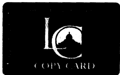
圖四 美國國會圖書館影印卡