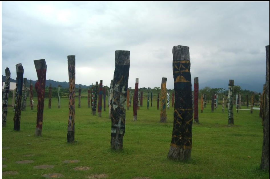
進入園區後，沿著筆直的公路直行，右前方即為原住民圖騰，感受濃濃的原住民文化。